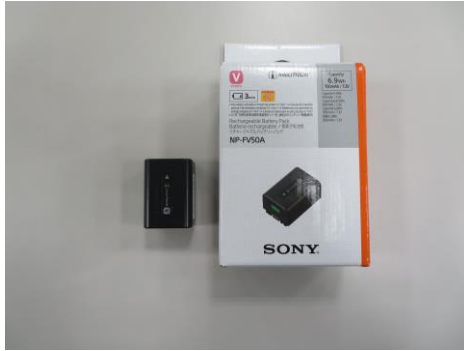
ビデオカメラバッテリー