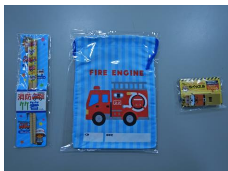
広報物品 (箸、巾着、ホイッスル)