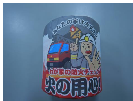
広報物品 (トイレットペーパー)