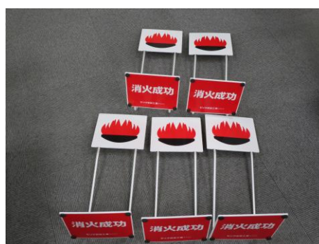
訓練用水消火器 標的